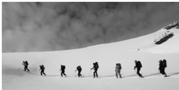
Aufstieg zum Tällihorn

Noch ganz hungerissen von der wunderbaren Abfahrt genossen wir die beste Polenta (die, welche alle gern haben) mit einem super Voressen mit Saucenzwiebeln und Rüebli in der richtigen Dicke und zum Dessert einen leckeren Apfelkuchen. An dieser Stelle sei Martin und Cornelia ganz herzlich für die exquisite Küche gedankt und natürlich all jenen, die tatkräftig mitmischten (gell Res).